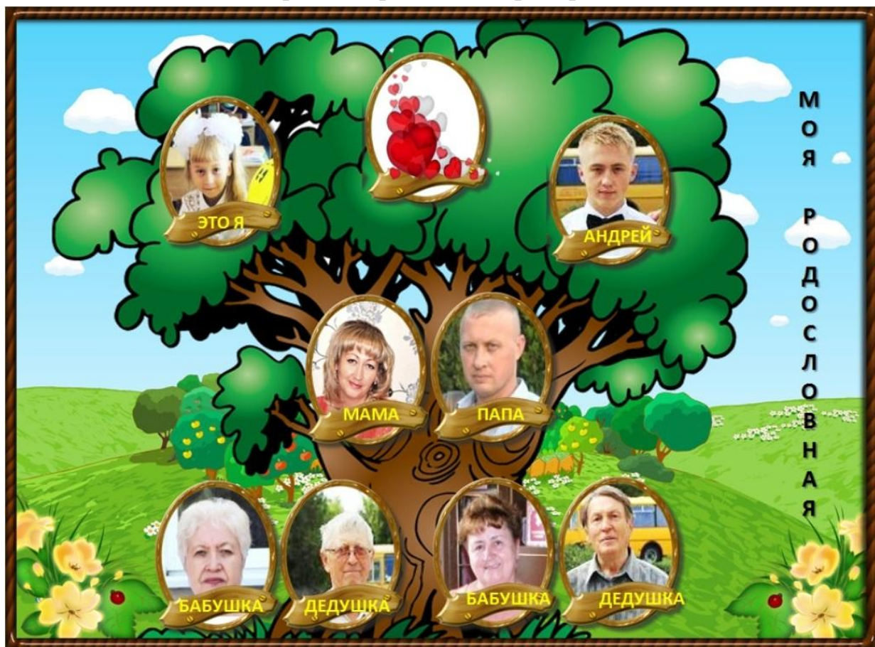
Моё Родословное древо

вить свое генеалогическое древо, еще его называют семейное древо, из которого все становится понятным и которое отображает историю развития нашей семьи.